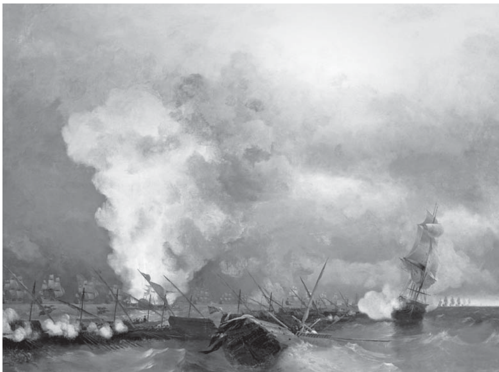
Морское сражение при Выборге 23 июня 1790 г.

Адмирал Чичагов немедленно блокировал весь шведский флот. После напряженного противостояния шведский король решился на прорыв между русскими кораблями. И снова отличились артиллеристы флагманского корабля «Ростислав», действиями которых умело руководил его командир Павел Чичагов. В этом сражении русские моряки уничтожили треть кораблей шведского флота. Флот адмирала Чичагова в корабельном составе потерь не имел. Выборгское морское сражение окончательно убедило шведов в морском могуществе России и в невозможности вступить один на один в единоборство с ней.