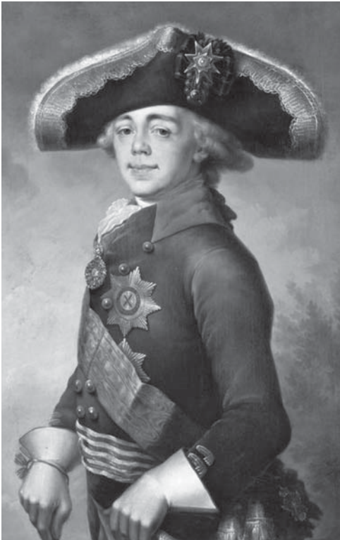
Император Павел I